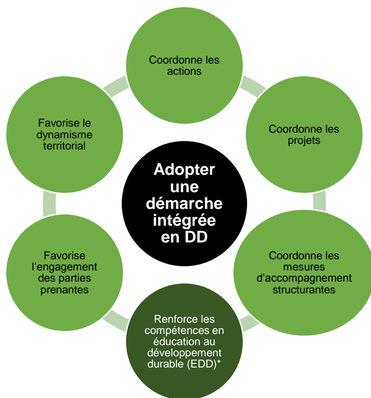
Diagramme 1 : Les impacts de l'adoption d'une démarche intégrée en développement durable

La démarche intégrée de l'Institut EDS adaptée au milieu scolaire dans le cadre de ce projet pilote préconise l'approche de l'éducation au développement durable (EDD), qui favorise une éducation au sein de laquelle les différents acteurs, dont les élèves, sont considérés comme des interlocuteurs valables. L'EDD mise également sur le développement de certaines compétences qui ont été identifiées comme étant centrales aux changements sociétaux qu'elle souhaite favoriser. Le milieu scolaire, suivant les principes de développement durable, sera accueillant, marqué par des valeurs d'écoute, de partage et de respect de l'autonomie.