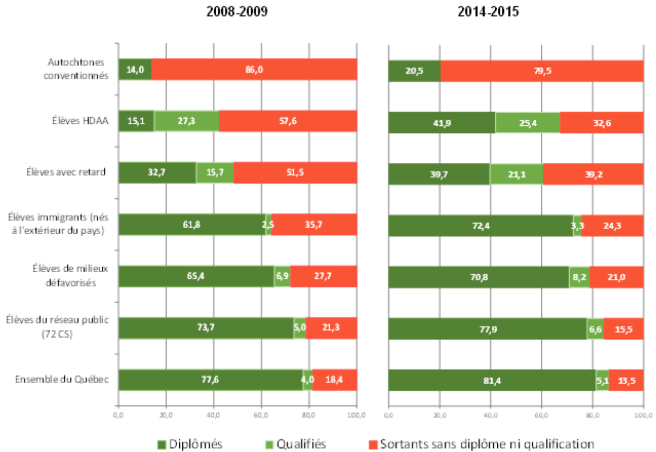
Répartition (en %) des élèves sortants du secondaire en FGJ selon certaines caractéristiques, ensemble du Québec, années scolaires 2008-2009 et 2014-2015

aux sortants sans diplôme ni qualification pour chaque groupe d'élèves. Ainsi, malgré des écarts persistants, des gains ont été réalisés et ces gains sont plus souvent associés à une hausse des diplômés plutôt qu'à une hausse des qualifiés.