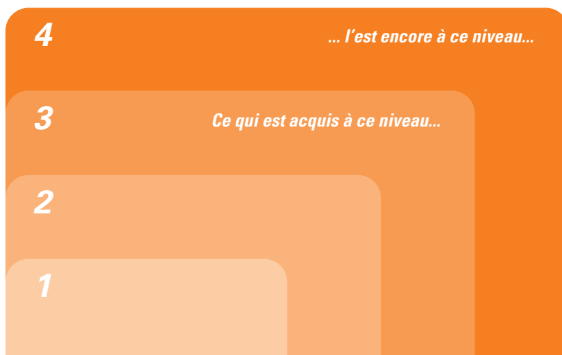
Tableau 2 – Caractère inclusif des niveaux de l'échelle

Il est à noter que les niveaux ont un caractère inclusif. Un aspect de la compétence qui est jugé acquis à un niveau donné est implicite dans les descriptions des niveaux supérieurs.